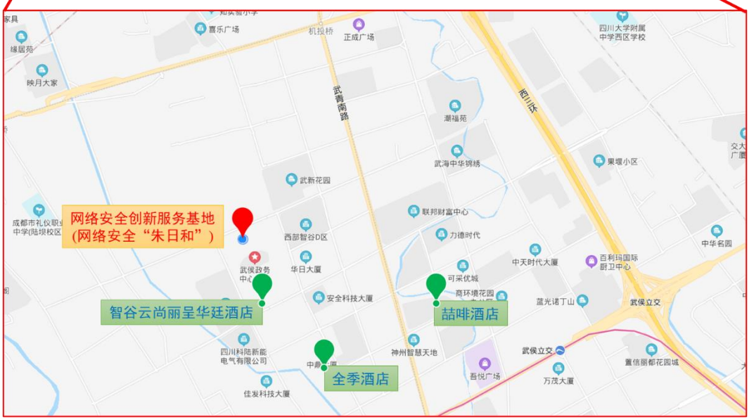
会场地址：四川省成都市武侯区西部智谷 B 区 4 栋